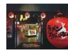
キャナルシティ博多

博多はもちろん、全国各地の人気ラーメン店8店舗が集結。様々なメディアに取り上げられる名店や地元で行列ができる店など、話題の麵屋が不定期で入れ替わりながら、自慢のメニューを提供している。キャナルシティ博多内の映画館や劇場のチケット半券で替玉などのサービスもあり。